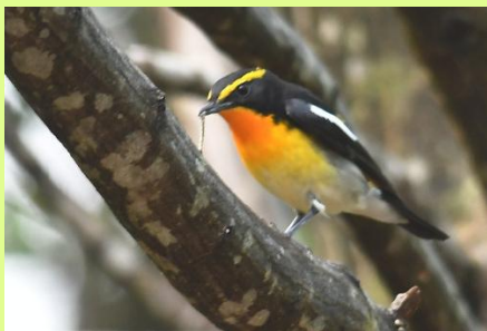
キビタキ 春になると繁殖のために南から渡ってくる里山を代表する夏鳥。