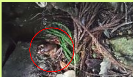
タゴガエル(包接中) 溪流沿いにいます。繁殖期、雄は岩や苔の下でよく鳴きます。