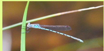
ホソミオツネントンボ 成虫で越冬するトンボ。山沿いのビオトープでよく見かける。