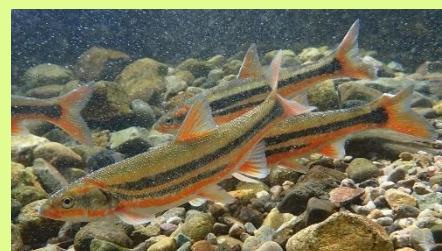
ウグイ 豊岡ではイスと呼ばれます。春になると、赤と黒の鮮やかな婚姻色になります。