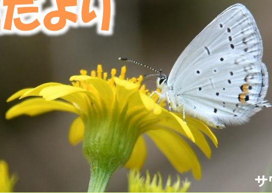
サワオグルマとツバメシジミ