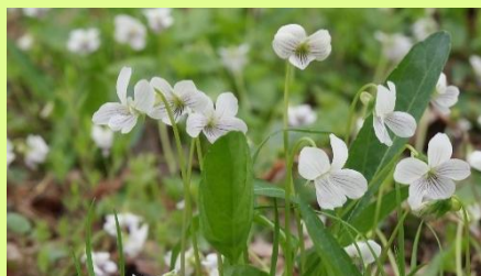
アリアケスミレ 4月はスミレの月。里で葉が長くて花が白いのはアリアケスミレです。